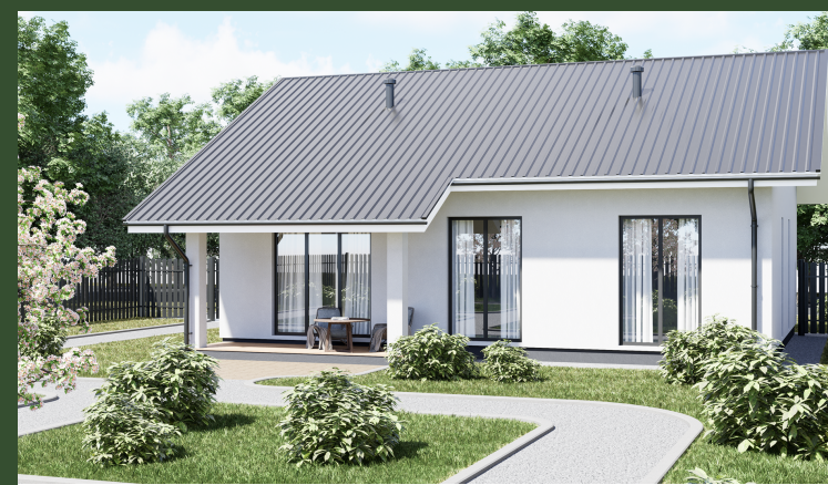
ДОМ С ТЕРРАСОЙ